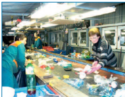
Text zpracoval: Zdeněk Hromek